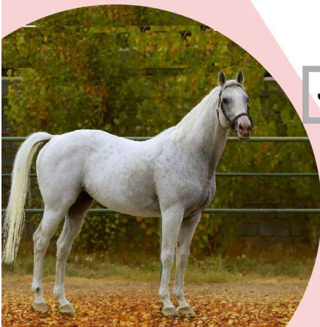
پدر اوسین بولت City leader